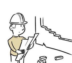
5. Feiten en cijfers