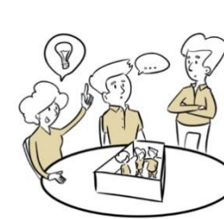
4. Integraal aanbod