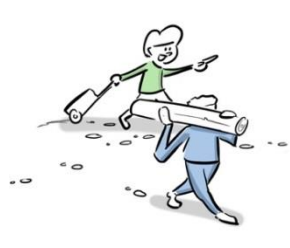
1. Ontwikkelen crisis hulp

Dit zijn de zes deelprojecten van het programma ontwikkeling zorglandschap jeugd Flevoland: