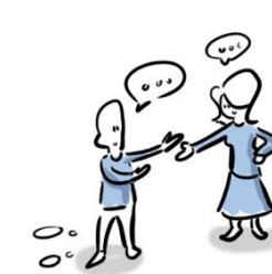
6. Communicatie en cliëntperspectief