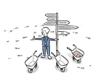
3. Basis op orde